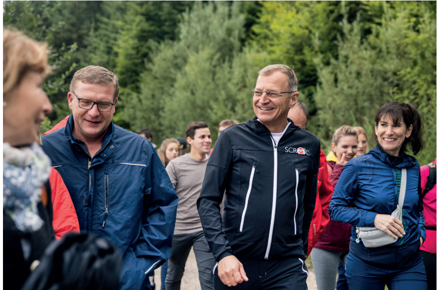
Landeshauptmann Thomas Stelzer möchte das Miteinander im Land weiter stärken.

Dazu organisiert die OÖVP den ganzen Sommer über in allen Regionen des Landes Veranstaltungen und Gelegenheiten zum gemeinsamen Austausch unter dem Motto „Sommer des Miteinanders“.