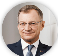
Thomas Stelzer Landeshauptmann

„Wir stehen zu unserer christlich-sozialen Verantwortung, indem wir jenen helfen, die unsere Hilfe brauchen.“