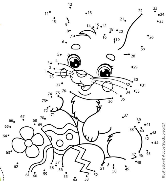
Illustration © Adobe Stock, oleon17